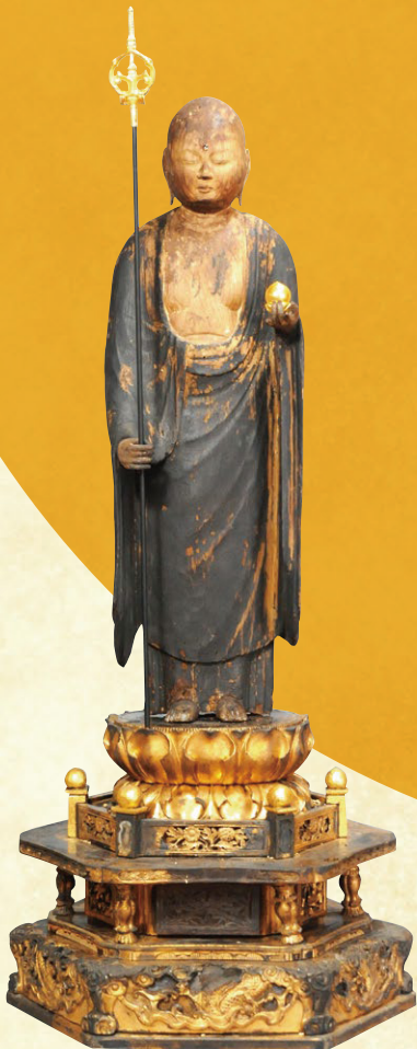
市指定 木造地藏菩薩立像(花池・薬師寺蔵)