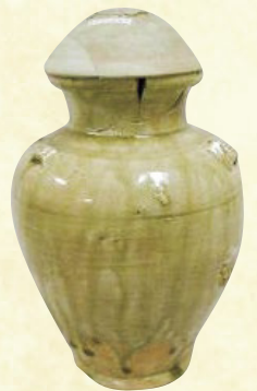
市指定 法圓寺中世墓出土遺物 一括のうち瀬戸三耳壺 (館蔵)

※身体障害者手帳・戦傷病者手帳・精神障害者保健福祉手帳・療育手帳 (ミライID可)を持参の方(付添人1人を含む)は無料