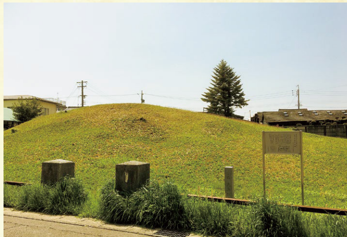
県指定 浅井古墳群のうち毛無塚古墳