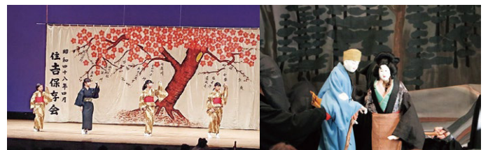
市指定 宮後住吉踊