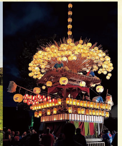
市指定 黒岩祇園祭