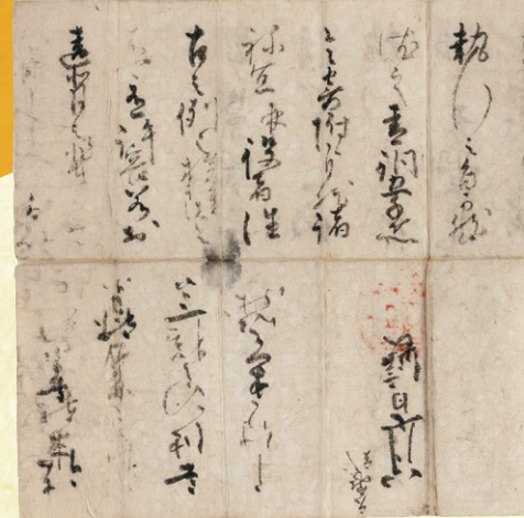
織田信長朱印状(部分)【2023年新収蔵】