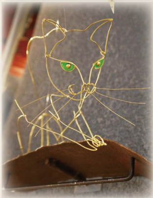
特別出品 水谷一子《cat》 2024年