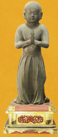
県登録 木造南無仏太子立像 (大和町・妙興寺蔵)