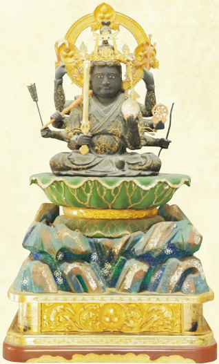
県登録 木造弁才天坐像 (大和町・妙興寺蔵)